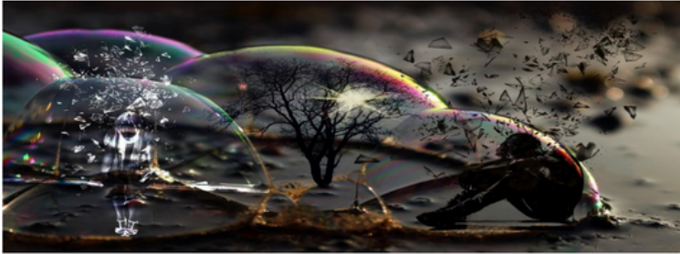
Werken met rouw en verlies bij mensen met een LVB

Na een periode van kennisdeling en profilering, onder andere via een eigen website, bracht 2021 nieuwe inspiratie. De werkveldgroep organiseerde een online studieavond over rouw en verlies bij mensen met een LVB, waarbij het delen van ervaringen en ideeën centraal stond. De reacties waren wederom zeer positief.