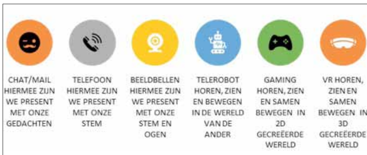
Figuur 1: Telepresentie-tools.

Mail, Chat en eHealth platforms zijn bekende vormen van telepresentie waarin het gaat om online schriftelijk communiceren als manier om gedachten over te brengen. Deze vorm wordt al veelvuldig ingezet. De insteek is vaak praktisch en er is weinig interactie. De therapeut reageert op het bericht wanneer hij tijd heeft, en is dan in gedachten bij de cliënt. Binnen eHealth platforms is het ook mogelijk om vragenlijsten te laten invullen, psycho-educatie te geven of een behandeling vorm te geven. Het gaat om informatie geven en krijgen. Beeldbellen heeft tijdens de coronacrisis een enorme vlucht genomen. Zowel werkenden als schoolgaande jeugd werden 'gedwongen' ermee te werken. Doordat men elkaar hierbij ook ziet, is er ook non-verbale communicatie aanwezig in het contact. Men is zichtbaar