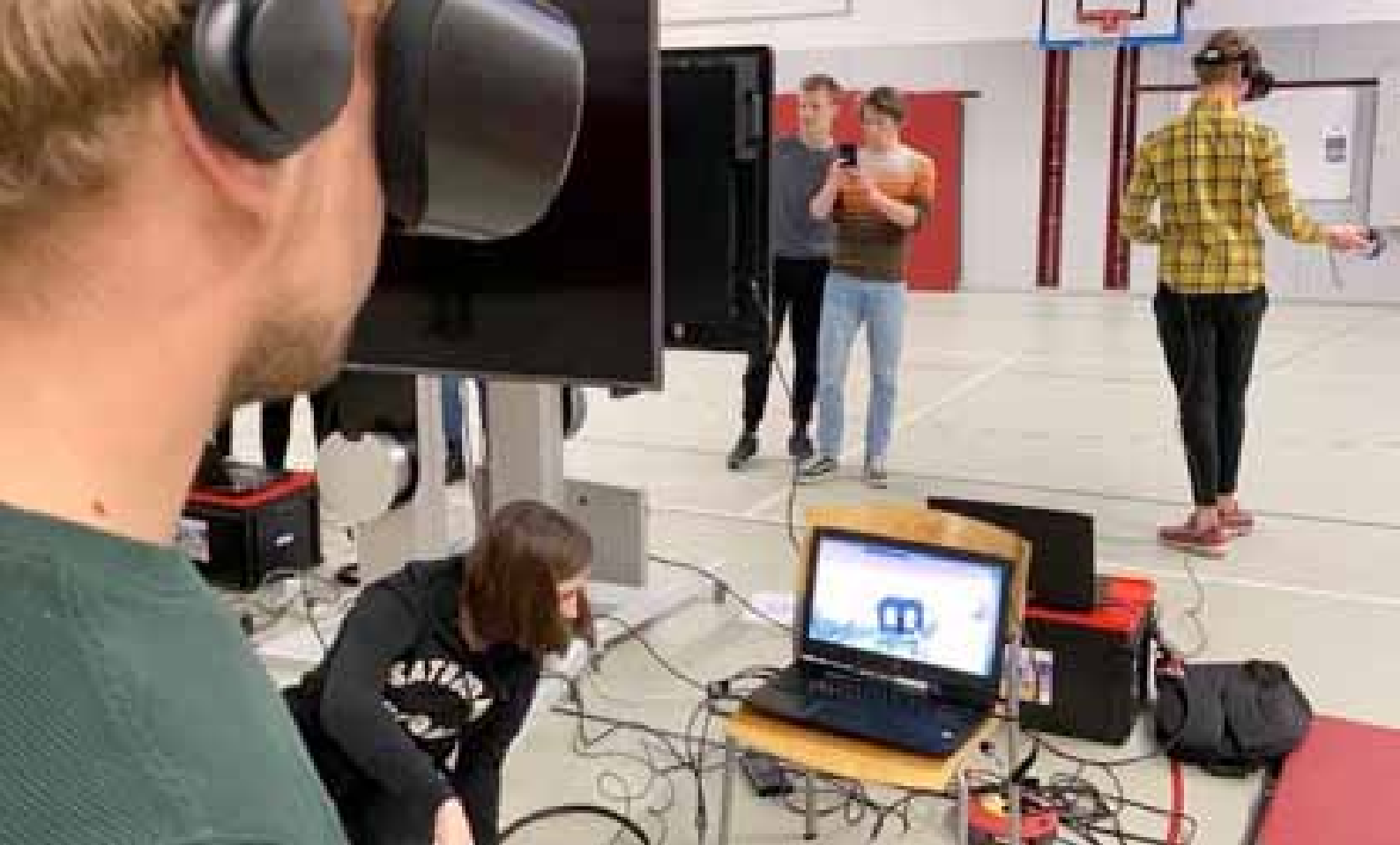
Afbeelding 5: Studenten psychomotorische therapie aan de HAN leren technologie integreren in de therapie.

voor elkaar en in staat om meteen te reageren. Om beeldbellen uit te breiden experimenteren therapeuten met het tijdens en tussen de sessies ook gebruiken van (bio)feedback. Hiermee krijgt de therapeut meer input om zijn interventies op af te stemmen. Beeldbellen is voor vaktherapeuten een redelijk toegankelijke manier om contact op te bouwen en onderhouden met de cliënt.