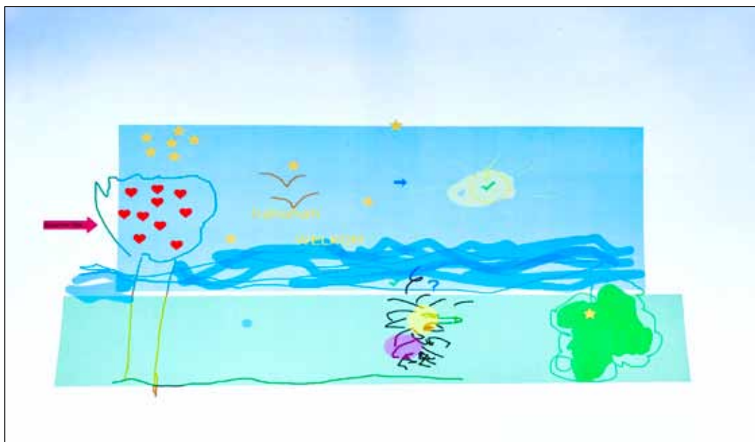
Afbeelding 1: Whiteboard groepstekening.

De aangeboden vaktherapeutische werkvormen kunnen zeer divers zijn. Hieronder een kleine greep uit de mogelijk-